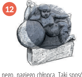
AUTOR NIEZNANY, [PUTTO] lub [AMOR]