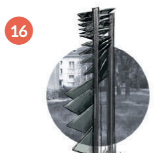
LUCJAN ORZECH, MAŁE ORGANY

Rzeźba została wykonana z metalu. Jej wymiary to około 254 × 160 × 184 cm. Składa się z postumentu w kształcie wygiętego ostrosłupa oraz z osadzonych na nim trójkątów, które, ułożone pod różnymi kątami, przypominają drzewko. Na powierzchni widać pozostałości po niebieskiej, zielonej i żółtej farbie (pierwotnie rzeźba była pokryta jedynie farbą antykorozyjną). Praca jest bardzo zniszczona i wymaga konserwacji. Mieszkańcy okolicznych osiedli nazywają tę kompozycję Choinką lub Żaglami . Historia powstania Ptaków jest ściśle powiązana z historią powstania rzeźby Małeka z os. Wandy..