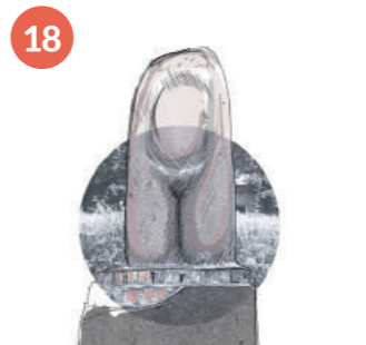
AUTOR NIEZNANY, RZEŻBY NA DZIEDZINCU WEWNĘTRZNYM SZPITALA IM. S. ŻEROMSKIEGO

Rzeźba przedstawia dziewczynkę ubraną w sukienkę lub szkolny fartuszek. Bryła ciała (np. dłonie) oraz ubiór są opracowane schematycznie. Natomiast twarz dziewczynki, mimo sumarycznego przedstawienia, została ukazana w bardziej realistyczny sposób. Z pracą łączy się lokalna anegdota głosząca, że jest to dziecko, które nie zostało odebrane przez rodziców z przedszkola.