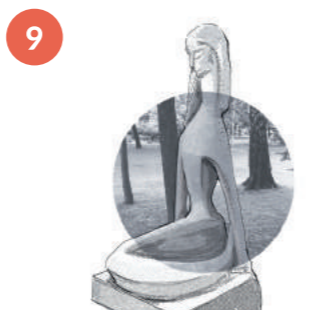
MAGDALENA JAROSZYŃSKA, SYRENKA

Rzeźba jest przykładem abstrakcji organicznej. Po socrealizmie (1949-1956) przedstawienia abstrakcyjne, zwłaszcza oparte na biologiczności, stały się popularne w sztuce polskiej. Technika mozaiki, jaka została zastosowana do dekoracji rzeźby, była bardzo powszechna w czasach PRL-u. Najbardziej znanym zakładem produkującym ceramikę była wówczas Spółdzielnia Wyrobów Ceramicznych „Kamionka”, działająca od 1947 roku w Łysej Górze koło Tarnowa.