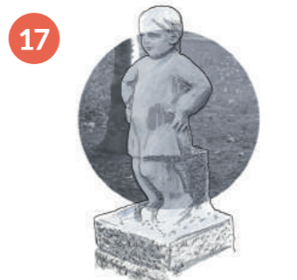
AUTOR NIEZNANY, [DZIEWCZYŃKA], [PRZEDSZKOLAK] lub [ANIA]