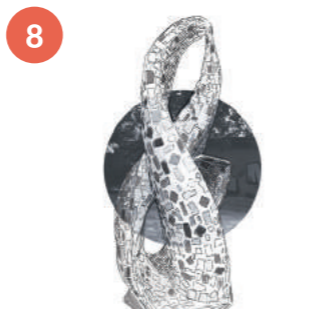
AUTOR NIEZNANY, [ŚLIMAK] lub [MUSZLA]

Potoczny tytuł pracy nawiązuje do jej kształtu. Rozbicie formy rzeźby i jej silna geometryzacja mogą wskazywać na inspirację kubizmem. Zainicjowany we Francji ok. 1906 roku rozszerzył myślenie o formie oraz przestrzeni w rzeźbie. Artyści tworzący ten kierunek zerwali z osiągnięciami sztuki dawnej, m.in. z zasadami perspektywy i mimetycznym odwzorowywaniem rzeczywistości.