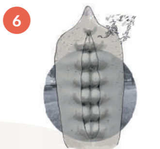
WINCENTY KUĆMA, DOJRZEWANIE II

Rzeźba o zoomorficznym kształcie, najprawdopodobniej przedstawia dwa zwrócone do siebie niedźwiadki lub pingwiny. Charakteryzuje się zwartą i sumaryczną formą. Powierzchnia rzeźby ma chropowatą fakturę, która imituje upierzenie.