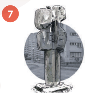
AUTOR NIEZNANY, [GITARA]